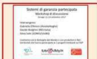
Davide Biolghini (Forum CT)