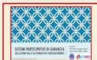
Silvia Salvi (CoRES)